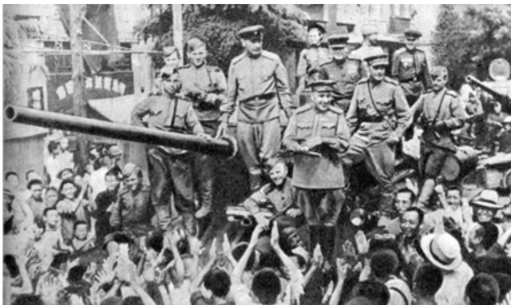
Трудящиеся Китая встречают советских воинов

В обращении Главнокомандующего советскими войсками на Дальнем Востоке к китайскому народу перед началом военных действий подчеркивалось, что “армия великого советского народа идет на помощь союзному Китаю и дружественному китайскому народу. Она и здесь, на Востоке, поднимает свои боевые знамена как армия-освободительница народов Китая, Маньчжурии, Кореи от японского гнета и рабства” . ( “Военная помощь СССР в освободительной борьбе китайского народа” , М., 1975, с. 89).