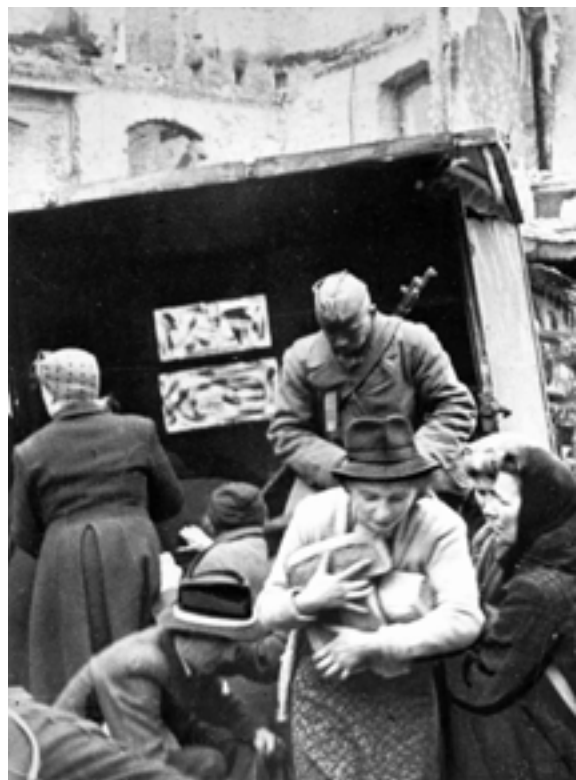
Раздача продуктов советскими воинами жителям Берлина. Май 1945 год

2 мая части фашистской армии были построены в колонны и в назначенных пунктах бросали в кучу оружие, знамена и сдавались в плен. В тот же день, 2 мая, помню, когда мы с группой офицеров и солдат проходили по Тиргартен-парку, то