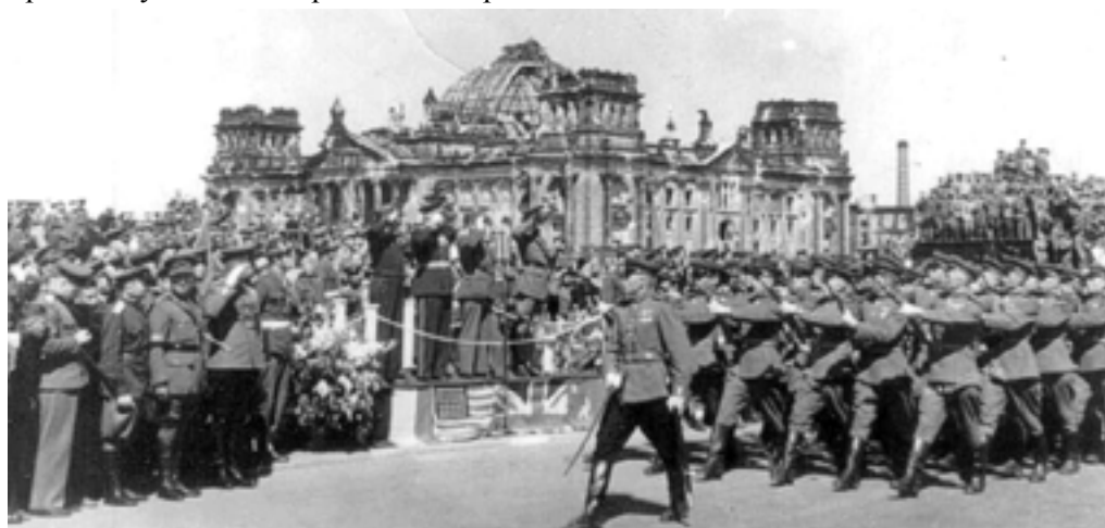
У поверженного рейхстага в парадном строю проходят советские воины

...Три дня я готовил свой танк Т-34 к торжественному прохождению у Бранденбургских ворот и поверженного Рейхстага. От мастерства механиков-водителей зависела слаженность и четкость движения всей колонны. Моя “тридцать четверка” не подвела, как и в бою, так и на марше не заглохла, не поломалась. Видимо, не зря из всей дивизии именно нашему экипажу было предоставлено это почетное право на участие в Берлинском параде Победы.