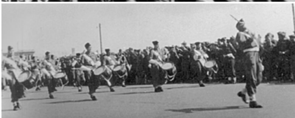
Фотоснимки с Парада победителей в Берлине сделаны Александром Дмитриевичем Пиносовым из села Каширино Кетовского района.