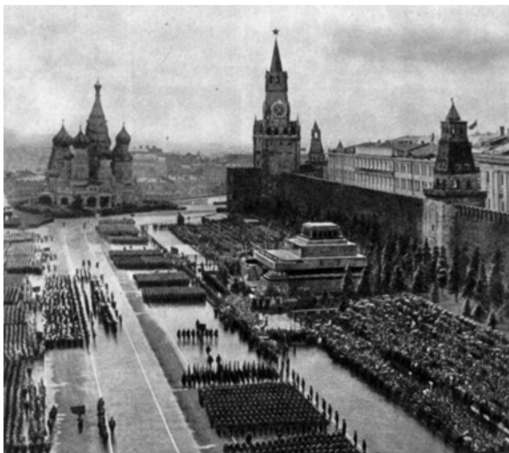
Победители на Красной площади

— Тогда через 20 минут в полной форме сюда. Поедешь на машине в штаб корпуса. Как орденоседец и геройский боец будешь представлять наш полк на Параде Победы. А солдаты твои подождут, пока из Москвы вернешься.