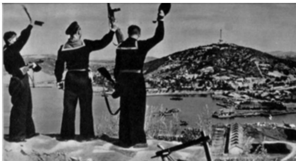
Моряки Тихоокеанского флота вернулись в Порт-Артур. Сентябрь 1945 года