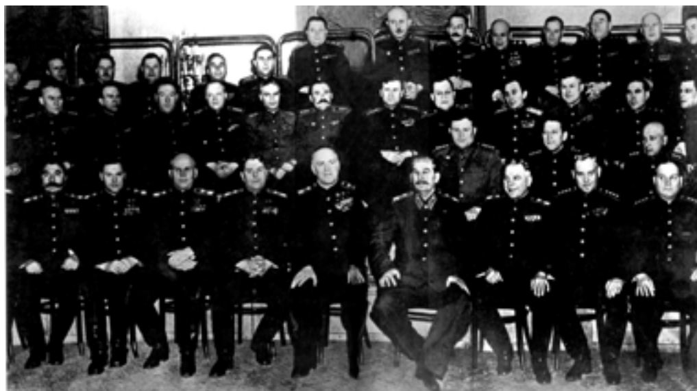
Фотография на память на приеме командующих войсками Красной Армии в Кремле 24 мая 1945 года

У нашего правительства было немало ошибок, были у нас моменты отчаянного положения в 1941 — 1942 годах, когда наша армия отступала, покидала родные нам села и города Украины, Белоруссии, Молдавии, Ленинградской области, Прибалтики, Карело-Финской республики, покидала, потому что не было другого выхода. Иной народ мог бы уже сказать правительству: вы не оправдали наших ожиданий, уходите прочь, мы поставим другое правительство, которое заключит мир с Германией и обеспечит нам покой. Но русский народ не пошел на это, ибо он верит