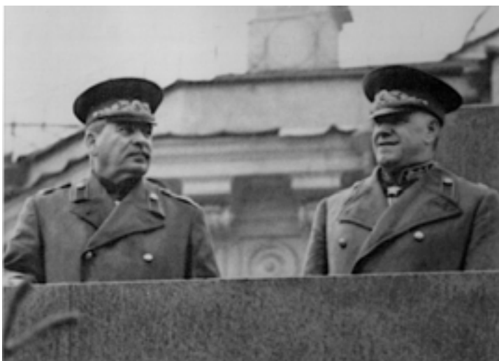
Иосиф Виссарионович Сталин и Георгий Константинович Жуков на Мавзолее

— Конечно, хочу. А как мои товарищи - солдаты?