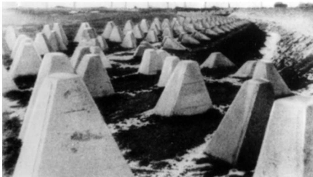
"Зубы дракона" - железобетонные надолбы у Зееловских высот. Апрель 1945 года

Над нашими позициями взвились серии красных ракет - сигнал общей атаки. Послышались команды: "Вперед! Ура!", доносящиеся слева и справа. Огневой вал уже успел укатиться к горизонту, в самую глубину немецкой обороны. И тотчас недалеко от моего НП ударил свет. Сначала один, длинный и узкий, словно клинок сабли яркий луч встал вертикально, упершись острием в темно-багровый купол над плацдармом. Затем вспыхнули разом десятки других лучей. И все вок-